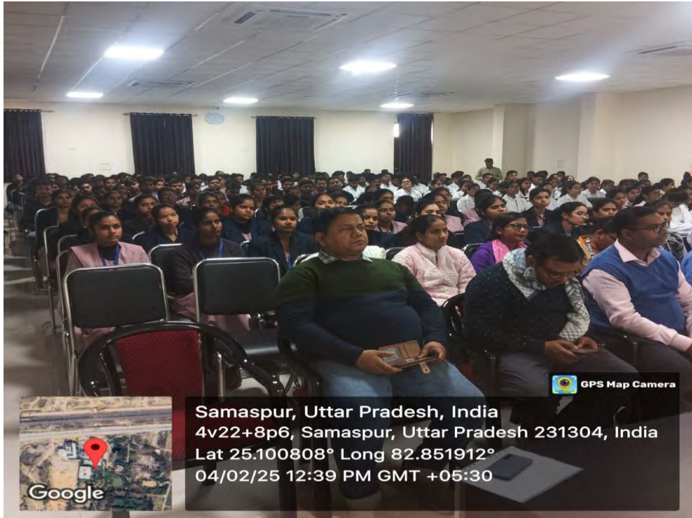
Samaspur, Uttar Pradesh, India 4v22+8p6, Samaspur, Uttar Pradesh 231304, India Lat 25.100808° Long 82.851912° 04/02/25 12:39 PM GMT +05:30