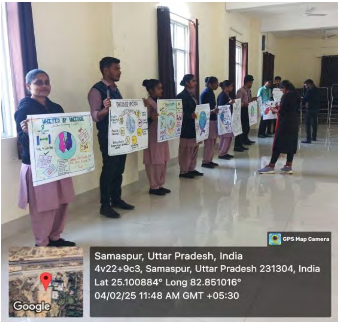
Samaspur, Uttar Pradesh, India 4v22+9c3, Samaspur, Uttar Pradesh 231304, India Lat 25.100884° Long 82.851016° 04/02/25 11:48 AM GMT +05:30