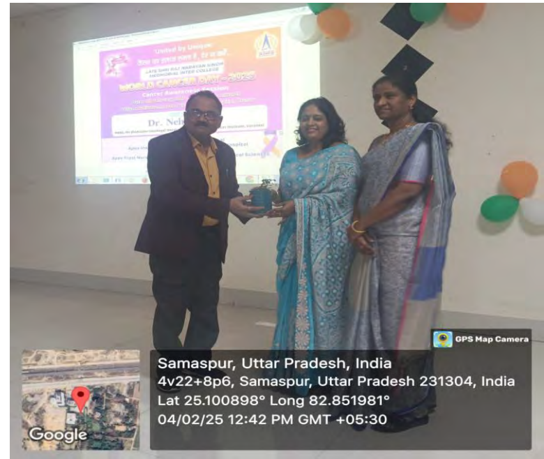
Samaspur, Uttar Pradesh, India 4v22+8p6, Samaspur, Uttar Pradesh 231304, India Lat 25.100898° Long 82.851981° 04/02/25 12:42 PM GMT +05:30