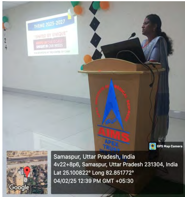
Samaspur, Uttar Pradesh, India 4v22+8p6, Samaspur, Uttar Pradesh 231304, India Lat 25.100822° Long 82.851772° 04/02/25 12:39 PM GMT +05:30